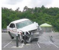
耐衝撃性実車実験の様様

高強度補強材を鋼管に内蔵することで強度を向上。日本道路協会の策定した基準に則り、HB種に対応しています。